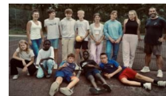
CLUB « LA JOIE DE VIVRE »

☑ Des actions d'autofinancement sur les prochains mois (Brocante pour la Fête de la Grosse à Fourneaux le 29 septembre, journée du troc à la salle de l'An 9 de Fourneaux le 24 novembre.) Les jeunes seront ravis de vous voir lors de ces journées. Tu as entre 11 et 17 ans, et cette aventure te tente ? N'hésite pas à contacter Clémence (Accompagnatrice des dynamiques jeunesse, ASAJ) au 06 16 74 58 02.