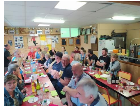
L'APRÈS FÊTE DES CLASSES